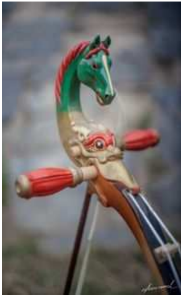
Morin khuur , la vièle mongole à tête de cheval

Deels flamboyants de couleur, vièles gracieuses et objets rituels partagent l'espace avec les majestueux paysages de la steppe mongole photographiés par Steve E. Morel. La projection de plusieurs courts-métrages musicaux invite à découvrir les sons étonnants du chant diphonique et du Morin khuur à travers l'interprétation de grands solistes et ensembles nationaux.