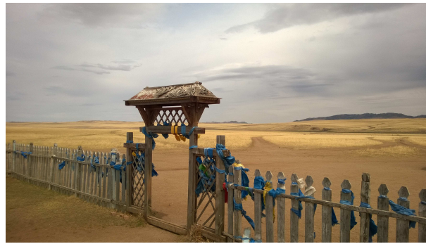
Khadak , écharpes sacrées bouddhiques

Laissez-vous transporter par le galop du Morin Khuur qui traverse les plaines de la Mongolie éternelle !